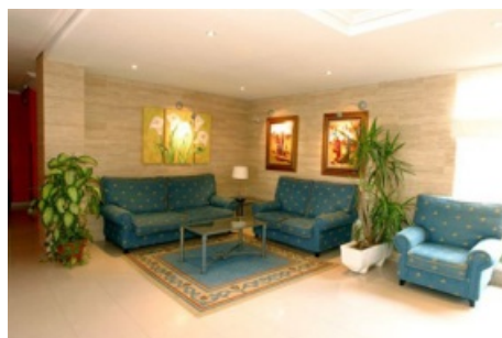
Ruhezone im Empfangsbereich