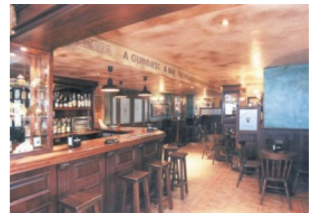
Taverne im Gebäudekomplex