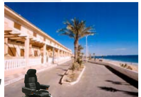
Beispiel eines Bungalows